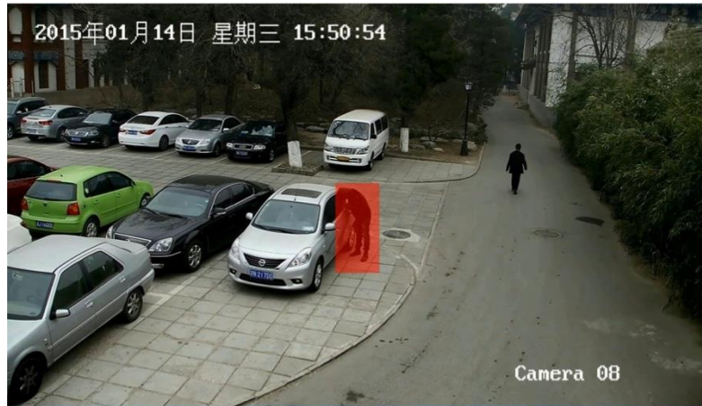
异常事件（敏感区域徘徊）视频示例