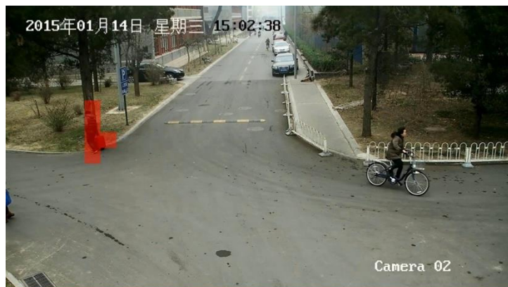
异常事件（丢弃箱包）视频示例