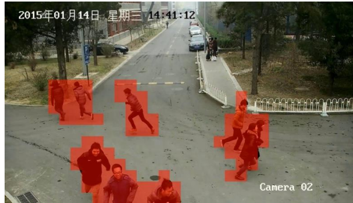
异常事件（群体逃散）视频示例