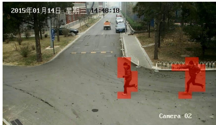
异常事件（追赶）视频示例