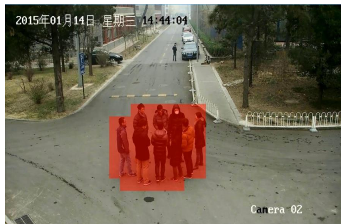
异常事件（群体聚集）视频示例